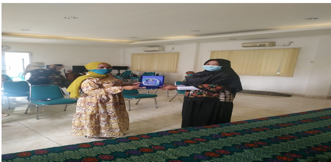
Gambar 4. Penyerahan Piagam