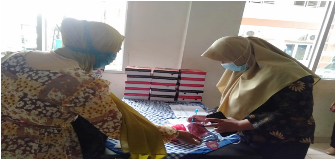
Gambar 1 Proses Pendaftaran/Absensi Peserta

19. Namun demikian pada prakteknya ternyata kesadaran masyarakat sekitar terkait pentingnya menerapkan protokol kesehatan masih kurang khususnya terkait menjaga jarak aman. Selain itu, mobilitas masyarakat juga masih sulit untuk dikendalikan baik untuk bekerja maupun hanya sekedar pergi keluar rumah. Dengan adanya sosialisasi ini maka diharapkan para peserta dengan wewenangnya sebagai perangkat desa dapat menularkan pengetahuan dan pemahaman mereka kepada masyarakat khususnya warga Kelurahan Ciputat. Berikut gambar foto pelaksanaan pengabdian kepada masyarakat: