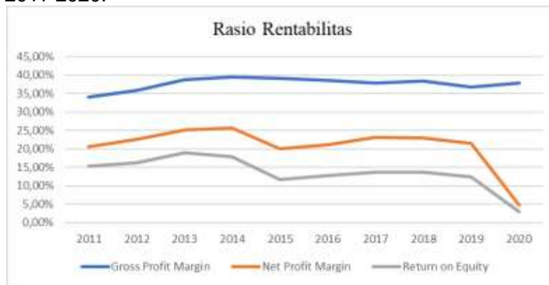
Gambar 3 Grafik Rasio Rentabilitas PT. Bank Negara Indonesia Tbk Tahun 2011 - 2020

Berdasarkan perhitungan di atas selama 10 tahun dari tahun 2011-2020, diperoleh nilai minimum 2,9% tahun 2020, nilai maksimum 19,0% tahun 2013, dikarenakan pengelolaan dari equity capital yang baik maka diperoleh net income yang lebih besar dari peningkatan equity capital tahun 2013, dan nilai rata - rata 13,5% diambil dari hasil merata – ratakan return on equity dari tahun 2011-2020.