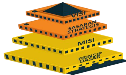
Gambar : 3.2 : Pendekatan Sistematis Smart City

Kemudian Penulis akan menyajikan diagram gambar yang berkaitan dengan pendekatan sistematis sebagai berikut: