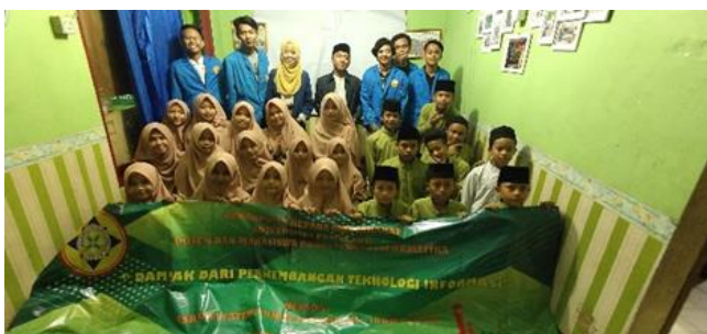
Gambar 3. 3 Foto Bersama Peserta dan Panitia