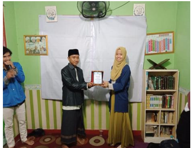
Gambar 3. 4 Memberikan Plakat Dilakukan oleh Ibu Widyah Sebagai Dosen