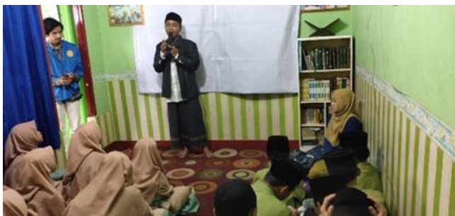
Gambar 3. 1 Sambutan Diberikan oleh Pengurus Yayasan