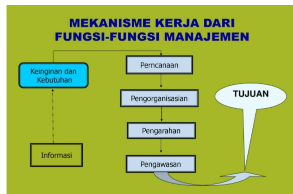
Gambar 2. Materi Manajemen Usaha

Tempat :dilakukan secara online menggunakan aplikasi zoom, Join Zoom Meeting: https://us02web.zoom.us/j/86866370950?pwd=RXdSMVJ6VEV4VU1ZVi9lVnpUbWJ0Zz09 , Meeting ID: 868 6637 0950, Password: 911173