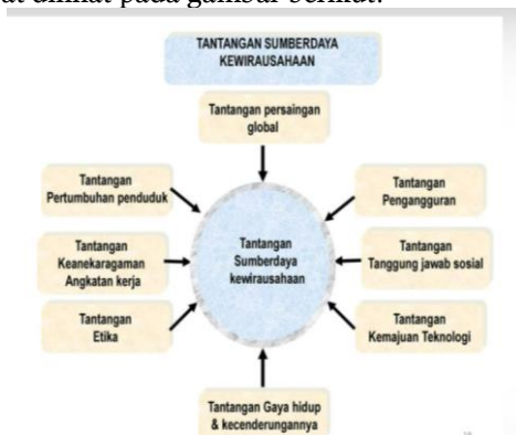
Gambar 3: Materi Manajemen Usaha

Pemaparan materi terkait manajemen usaha dapat dilihat pada gambar berikut: