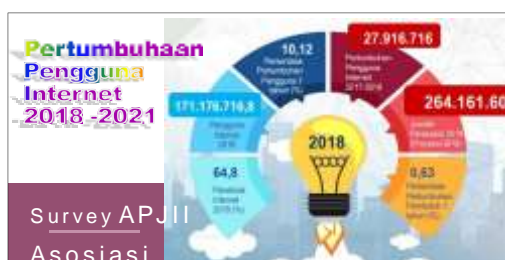
Gambar 2 . Pertumbuhan Pengguna Media proposi Melalui Internet

Berdasarkan hasil observasi awal, diketahui terdapat beberapa masalah umum yang dihadapi oleh UMKM di Desa Sukarame terkait rendahnya pemahaman Sumberdaya Manusia dan pemasaran yang kurang baik yaitu : kurang adanya informasi serta aksi dari para stakeholder Desa Sukarame untuk membuat perkumpulan dan pelatihan terkait usaha yang ditekuni, permasalahan pemasaran yang ditekuninya, dan masalah persaingan usaha dengan pendatang di Desa Sukarame Carita yang lebih maju karena lebih inovatif menggunakan teknologi dalam melakukan usahanya.