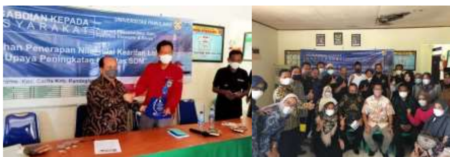
Gambar: 3 Penandatanganan MoU dan Pelatihan

wisatawan setempat dan dari mulut ke mulut ( word of mouth ) Sementara iklan merupakan salah satu alat marketing untuk memperlihatkan dan menjual produk dari perusahaan kepada masyarakat tertentu. Kurangnya pengetahuan pemasaran sampai dengan adaptasi terhadap internet dan perkembangan teknologi yang dialami pelaku UMKM Desa Sukarame Pantai carita ini, menjaditantang dan masalah yang harus dicarikan solusinya.