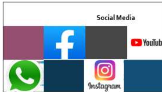
Gambar 4. Media Promosi melalui Sosial Media.

Promosi yang bagus dapat dilakukan dengan melakukan riset dan analisis terhadap pasar. Saat ini merupakan era dimana Internet menjadi salah satu bagian yang tidak dapat dipisahkan dari kehidupan bermasyarakat. Kelengkapan dan kejelasan informasi menjadi salah satu factor pemicu kepercayaan masyarakat terhadap suatu lembaga. Kegiatan Pengabdian Masyarakat merupakan salah satu bentuk Tri Darma Dosen di lingkungan Perguruan Tinggi.