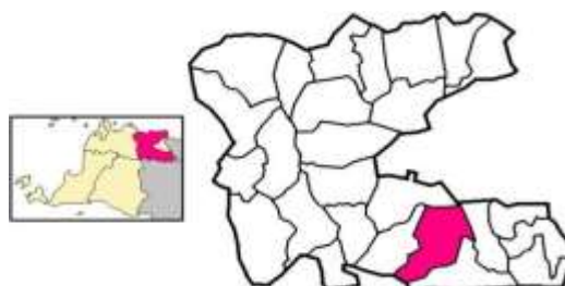
Gambar 1. Peta Wilayah Kecamatan Carita Padeglang

Desa Sukarame Carita adalah sebuah kecamatan di Kabupaten Pandeglang, Provinsi Banten, Indonesia. Di kecamatan Carita ini terletak pingiran pantai dari Anyer yang sangat indah dengan hamparan dan pemandangan ke lautan Carita, tepatnya di Desa Sukarame Kecamatan Carita Kabupaten Pandeglang Provinsi Banten.