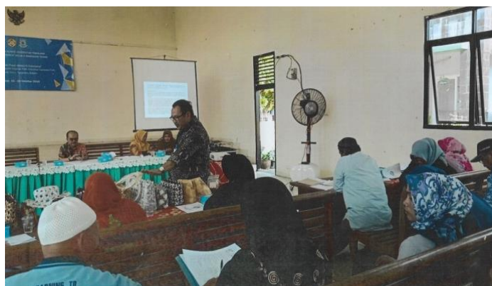
Gambar 3. Sosialisasi dengan Koperasi Patih

Pelaksanaan kegiatan Pengabdian Kepada Masyarakat berjalan dengan lancar dan mendapat sambutan hangat baik dari Lurah Cempaka Putih kecamatan Ciputat beserta staf, Ketua Koperasi maupun peserta IKM/UMKM sebagai anggota Koperasi Patih dan bahkan diminta oleh peserta untuk dilanjutkan kegiatan bimbingan ini terutama praktek cara pengisian dokumen ekspor.