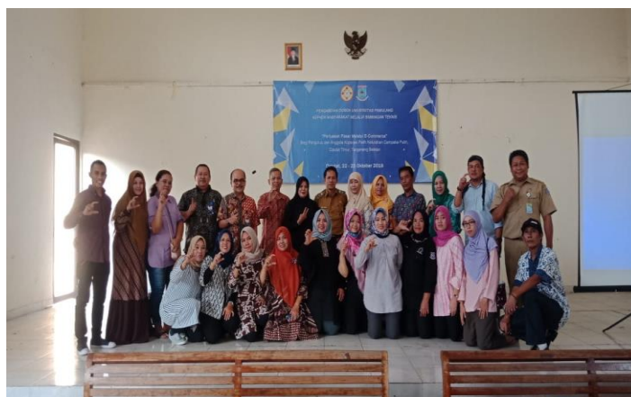
Gambar 4. Foto Bersama PKM dengan Pengurus Koperasi Patih

Untuk selanjutnya, perlu dilakukan bimbingan teknik terutama terkait dengan materi praktek cara pengisian dokumen ekspor.