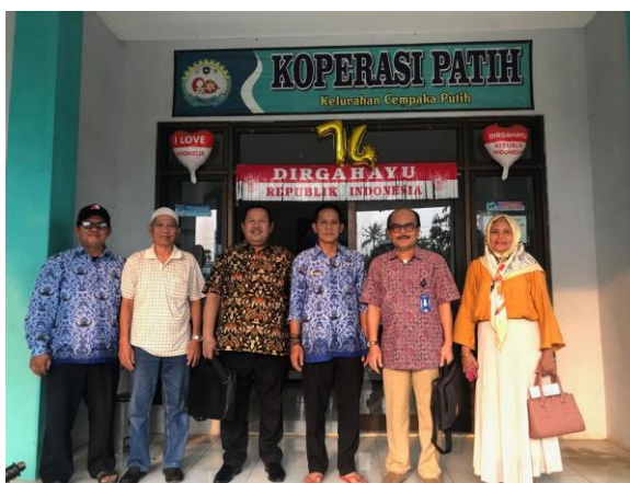
Gambar 1. Foto Besama Pengurus Koperasi Patih Sejahtera Mandiri

Berdasarkan fenomena tersebut, maka diadakan Bimbingan Teknis Manajemen Peningkatan Penjualan Melalui E-Commerce Kepada IKM/UMKM Koperasi Patih Sejahtera Mandiri di Kelurahan Cempaka Putih Kecamatan Ciputat Kota Tangerang Selatan Provinsi Banten.