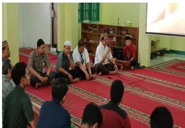
Gambar 3. Pembukaan oleh Tim PKM

Hasil pengabdian masyarakat yang diperoleh adalah bertambahnya keilmuan remaja masjid Al Hikmah mengenai kewirausahaan dan dapat menjalankan usaha dengan bekal ilmu dan wawasan mengenai kewirausahaan yang diberikan.