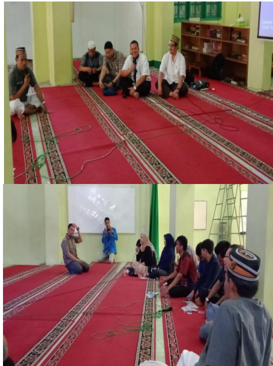
Gambar 5. Sesi Diskusi dan Tanya Jawab bersama remaja masjid Al Hikmah yang bertanya dan menjawab kuis dari Tim PKM Dosen Universitas Pamulang

Adapun gambar di atas yaitu diskusi dan tanya jawab antara remaja masjid Al Hikmah kepada Tim PKM, kemudian Tim PKM yang merupakan dosen-dosen Unsam menanggapi dan menjawab pertanyaan yang diajukan oleh remaja masjid Al Hikmah.