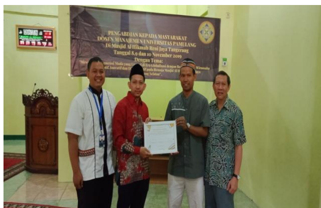
Gambar 4. Pemberian Piagam Penghargaan

Kegiatan pada gambar di atas pembukaan dan doa agar seluruh rangkaian kegiatan PKM dapat berjalan lancar, yang dilanjutkan dengan mengadakan ice breaking sebelum pemberian materi kewirausahaan agar remaja masjid- lebih fokus dalam mengikuti penyuluhan yang dilakukan dosen-dosen Fakultas Ekonomi Universitas Pamulang.