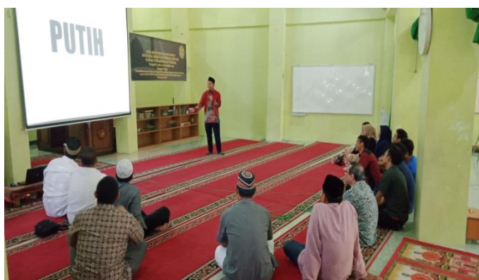
Gambar 2. Tim PKM Dosen Universitas Pamulang Sedang Memberikan Materi

Tahap kedua yaitu : Diskusi, Tanya Jawab dan Bimbingan dalam menjalankan bisnis, yaitu bimbingan bagaimana cara menjual produk dan kemudian dibimbing sampai remaja masjid benar-benar dapat memulai dan menjalankan usahanya.