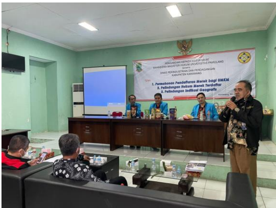
Gambar 3 : Penyampaian Materi