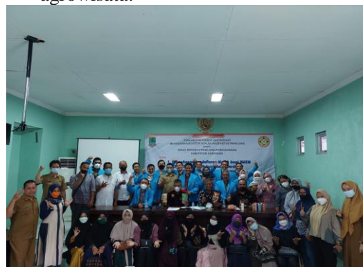
Gambar 1 : Peserta PKM