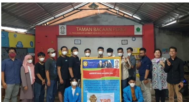
Foto Tim Dosen Manajemen dengan Peserta dari Taman Bacaan Perigi Sawangan-Depok

Hasil kegiatan yang digunakan kepada peserta yang hadir dan pengelola Taman Bacaan Perigi adalah dengan memberikan penjelasan materi teori terlebih dahulu baru kemudian peragaan dengan menggunakan media yang sudah disiapkan untuk penerapan manajemen sumber daya manusia sederhana di Taman Bacaan ini.