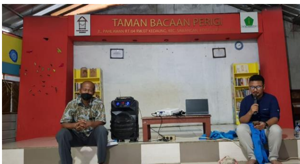
Dok. Pelaksanaan Bedah Buku

Hasil kegiatan yang digunakan kepada peserta yang hadir dan pengelola Taman Bacaan Perigi adalah dengan memberikan penjelasan materi teori terlebih dahulu baru kemudian peragaan dengan menggunakan media yang sudah disiapkan untuk penerapan manajemen sumber daya manusia sederhana di Taman Bacaan ini.