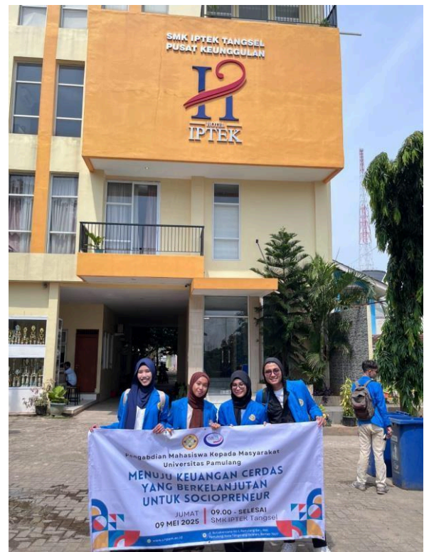
Gambar 4. Foto kelompok