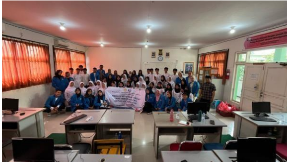
Gambar 1. Foto bersama siswa SMK IPTEK