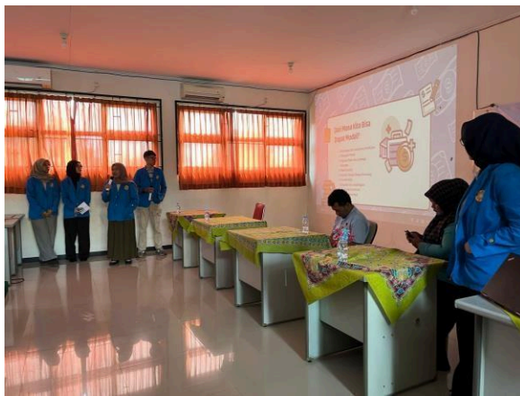
Gambar 2. Foto Penyampaian materi