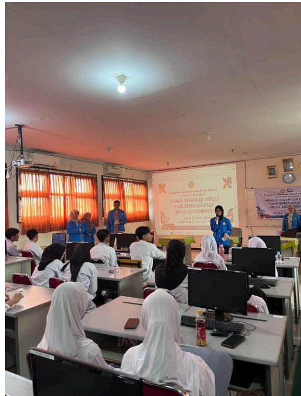
Gambar 3. Foto saat dilakukan diskusi