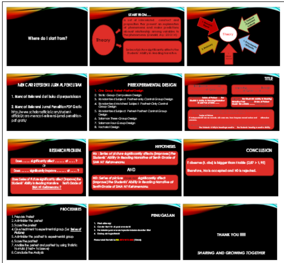
Gambar 2. Materi Seminar Penulisan Artikel Penelitian Bagi Guru-Guru Bahasa Inggris

Adapun materi seminar penulisan artikel penelitian bagi guru-guru Bahasa Inggris yang dipaparkan berupa slide presentasi power point, adalah sebagai berikut;