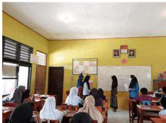
Gambar 5. Sesi permainan