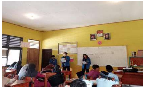
Gambar 4. Penyampaian materi

penasihat. Pelaksanaan kegiatan penyampaian materi ini dilaksanakan dengan mengacu pada rencana pembelajaran yang sudah disusun agar penyampaiannya terstruktur dan efektif dalam penggunaan waktu. Penggunaan bantuan gambar yang mencerminkan tema masing-masing lagu dibutuhkan agar para siswa mendapatkan gambaran visual dalam pembelajaran sehingga memudahkan para siswa memahami materi. Pembelajaran menggunakan media kartu gambar meningkatkan penguasaan kosakata bahasa Inggris siswa (Novianti, 2020) Masing-masing lagu, disediakan 10 gambar berwarna dalam pelaksanaan kegiatan pengabdian ini.