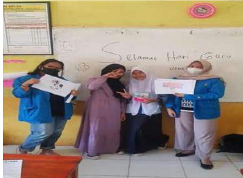
Gambar 6. Sesi pemberian hadiah