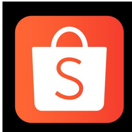
Gambar 1: Logo Shopee

Shopee memiliki visi dan misi perusahaan, yaitu: