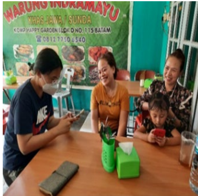
Gambar 2. Wawancara dengan Konsumen Warung Indramayu