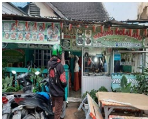
Gambar 1. UMKM Warung Indramayu

Kegiatan ini dilakukan oleh mahasiswa dari Universitas Internasional Batam bersama pemilik UMKM dalam membantu perkembangan UMKM Warung Indramayu dengan menyelesaikan permasalahan serta memberikan solusi. Hasilnya dari kegiatan ini menunjukkan bahwa pemilik UMKM sudah memiliki pemahaman dasar tentang bagaimana cara membuat konten yang menarik untuk memasarkan produknya. Kemudian dalam proses pembuatan akun media sosial dan pemilihan konten yang berdasarkan hasil analisa dari data-data wawancara yang telah dilakukan kepada konsumen UMKM Warung Indramayu yang hasilnya adalah mayoritas milenial, maka ditentukanlah konten marketing untuk membantu pemasaran UMKM Warung Indramayu adalah dengan menggunakan postingan dan video karena hasil data clustering konsumen mayoritas menyukai kedua jenis konten tersebut serta channel yang digunakan agar dapat menjangkau tiap konsumen tersebut yaitu platform Instagram dan TikTok sebagai media untuk melakukan pemasaran.