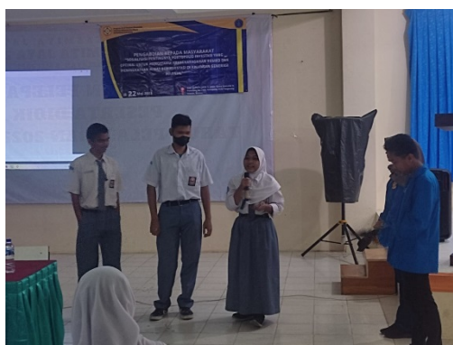
Gambar 3. Sharing section antara pelaksana dan peserta