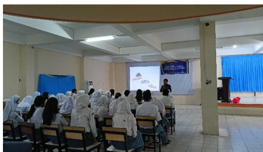
Gambar 2. Peserta mengikuti sesi pemaparan materi