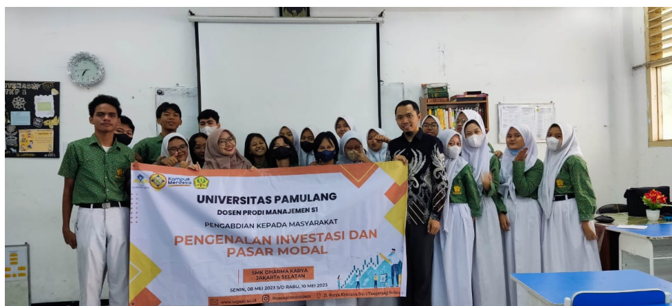
Gambar 5. Foto bersama peserta

Acara di akhiri dengan games dan juga pemberian bingkisan kepada para peserta yang telah mengikuti kegiatan Pengabdian Kepada Masyarakat. Peserta Pengabdian Kepada Masyarakat terlihat antusias dalam mengikuti kegiatan Pengabdian Kepada Masyarakat ini. Mereka mampu memaksimalkan kegiatan ini, karena seminar dilaksanakan dengan sistem diskusi sehingga peserta PKM bisa langsung bertanya dengan leluasa dan materi dapat tersampaikan dengan baik. Tidak lupa pada seminar ini tim dosen melakukan ice breaking yang mampu mencairkan suasana, ditambah dengan peran aktif moderator yang memandu kelancaran sesi materi dan tanya jawab, sehingga acara berjalan dengan kondusif.