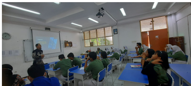
Gambar 3. Pemaparan materi pada siswa - siswi SMK Dharma Karya

Pemaparan materi kedua di sampaikan oleh Bapak Wirawan Suryanto, S.E., M.M. materi yang disampaikan adalah pengenalan pasar modal. Pada penyampain materi ini di berikan pula gambaran secara umum bagaimana kita dapat berinvestasi pada pasar modal. Penyampaian materi ini sangat membuat para siswa antusias, hal ini dikarenakan hal yang baru bagi para siswa.