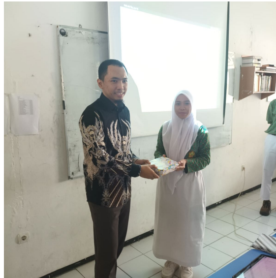
Gambar 4. Penyerahan hadiah kepada peserta

sangat penasaran dengan apa yang di jelaskan oleh para narasumber dan juga jawaban yang di berikan oleh para narasumber.