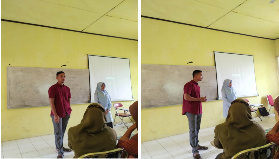
Gambar 1. Pengenalan Literasi Pasar Modal

Pelaksanaan kegiatan diawali dengan pengenalan tim pengabdian kepada mahasiswa, kemudian maksud dan tujuan melakukan pengabdian yaitu memberikan pembelajaran mengenai Pengenalan literasi pasar modal dan hukum investasi untuk mahasiswa tingkat akhir Universitas Pasir Pengaraian sehingga mempunyai pemahaman terhadap literasi keuangan pasar modal dan hukum investasi. Investasi pada dasarnya merupakan kegiatan penanaman modal sehingga memperoleh profit atas sejumlah uang yang ditanamkan tersebut. (Rudi Abdullah, 2021)