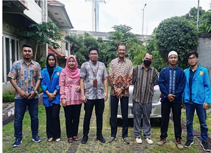
Gambar 3. Foto Bersama Panitia Pembangunan Masjid Al-Aulia dan Mahasiswa Universitas Pamulang