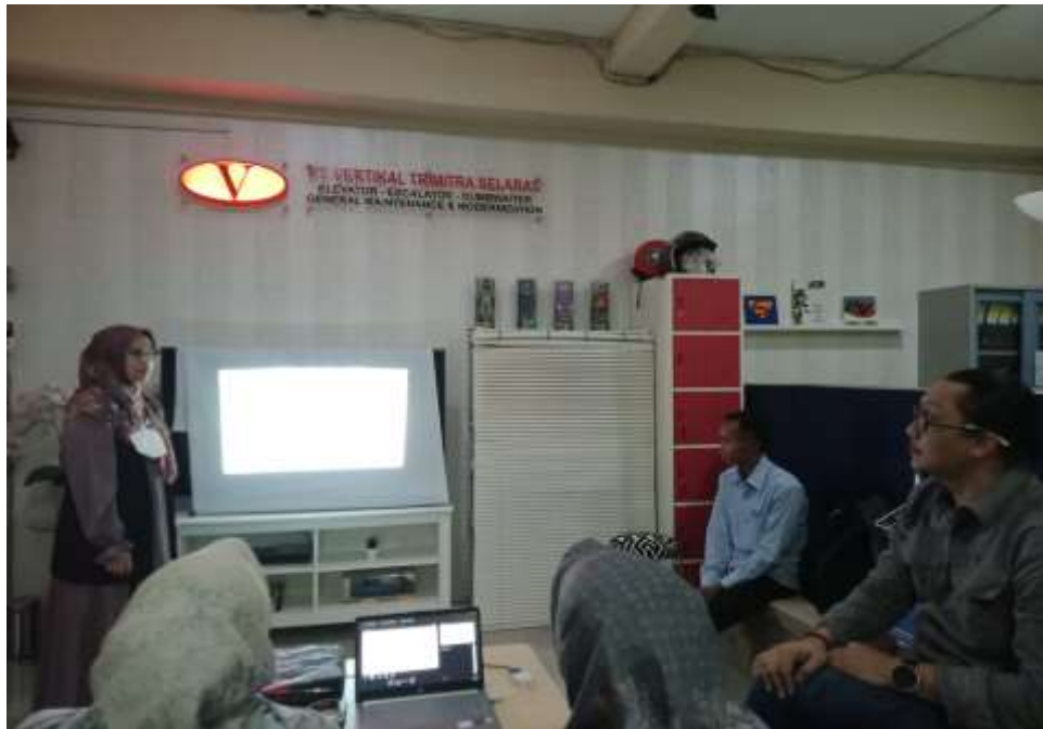
Gambar 2. Pemaparan Materi oleh Tim PKM

Pemaparan materi yang dikemas dengan cukup singkat disertai dengan soal kasus dan solusi. Peserta yang mengikuti kegiatan ini diberikan bertanya, jika hal yang disampaikan berkaitan dengan masalah yang berkenaan dengan pekerjaan, Berikut ini adalah dokumentasi saat memaparkan materi.