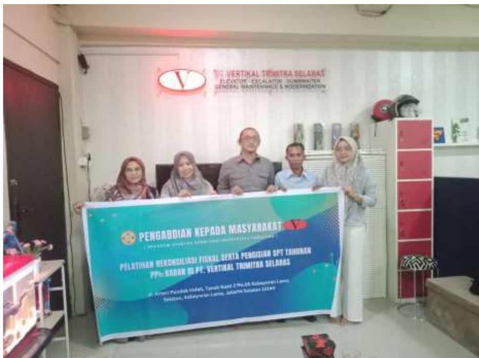
Gambar 3. Dokumentasi Tim PKM dengan manajemen PT VTS

Pelaksanaan pengabdian selain dilakukan secara tatap muka langsung ditempat PT Vertikal Trimitra Selaras, juga dilakukan diskusi secara online. Untuk pengisian efilling atau eform pelaporan SPT melalui DJP online, tim PKM memberikan advice atau pendampingan secara online jika diperlukan artinya sifatnya tentative. Dokumentasi hasil kegiatan pengabdian kepada masyarakat di PT Vertikal Trimitra Selaras adalah sebagai berikut :