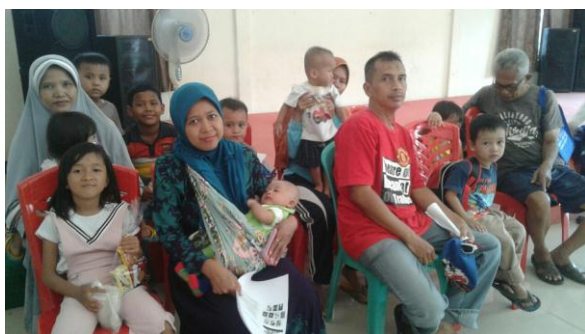
Gambar 2. Beberapa Peserta PkM

Berikut ini dokumentasi partisipasi peserta dalam kegiatan PkM.