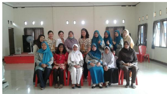
Gambar 4. Foto Bersama Peserta dan Narasumber

Sejalan dengan manajemen perencanaan perilaku hidup bersih dan sehat yang sudah disosialisasikan, bahwa indikator terendah akan menjadi perhatian untuk mengambil langkah selanjutnya.