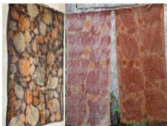
Gambar 3. Hasil eksperimen ecoprint.

Selama proses praktik, peserta didorong untuk bereksperimen dengan berbagai kombinasi bahan alami dan teknik Ecoprint. Mereka mencoba memadukan motif, warna, dan tekstur untuk menciptakan produk yang unik dan menarik. Seperti pada gambar 3. hasil eksperimen yang dilakukan pelaku UMKM.