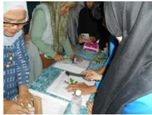
Gambar 2. Pelaku UMKM melakukan teknik steaming Ecoprint