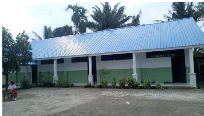
Gambar 3. Lokasi Sekolah Kegiatan Pengabdian Masyarakat

Berdasarkan wawancara, tanya jawab dan pengamatan langsung selama kegiatan berlangsung, kegiatan pengabdian pada masyarakat ini memberikan hasil sebagai berikut: