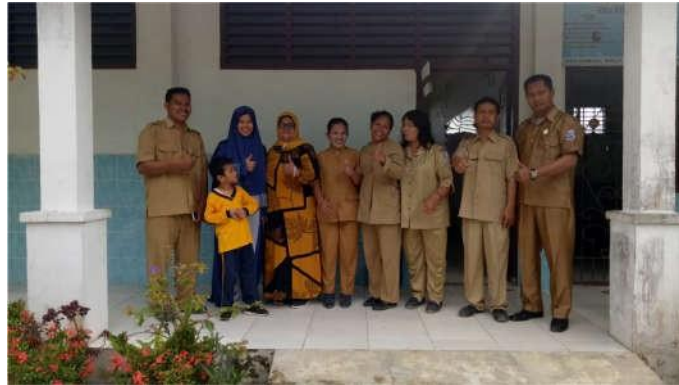
Gambar 2. Kegiatan foto bersama dengan guru/peserta Kegiatan Pengabdian Masyarakat