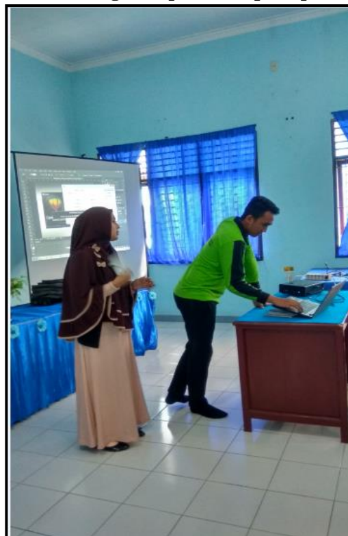
Gambar 2. Foto Kegiatan Pre-test salah satu siswa