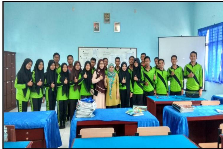
Gambar 3. Kegiatan Foto bersama peserta Siswa/ i

Berdasarkan wawancara, tanya jawab dan pengamatan langsung selama kegiatan berlangsung, kegiatan pengabdian pada masyarakat ini member ikan hasil sebagai berikut: