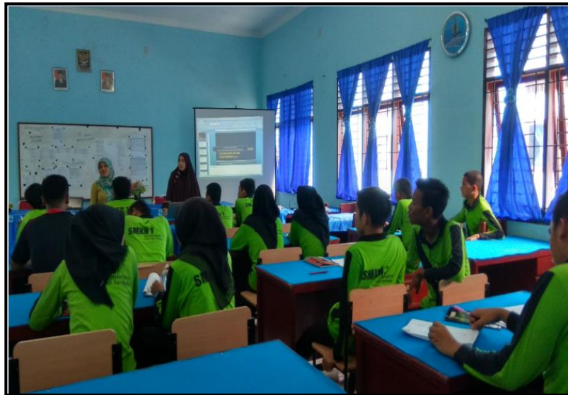
Gambar 1. Foto Kegiatan pelatihan pemaparan Materi