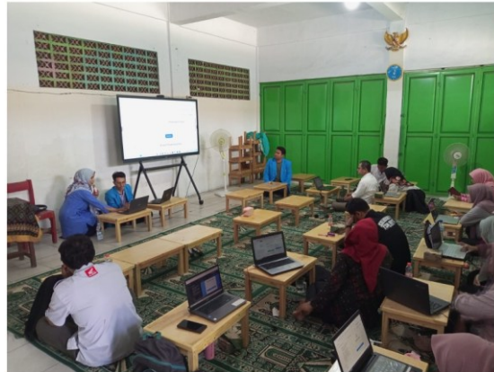
Gambar 2. Presentasi Guru dari hasil pembelajaran