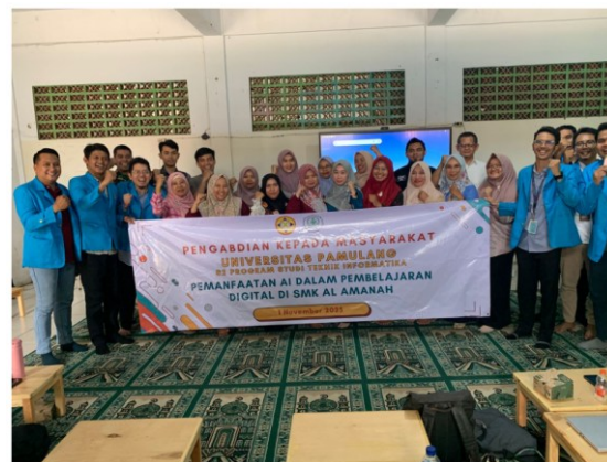
Gambar 3. Foto Bersama guru dan team PKM

Selanjutnya kegiatan praktik menunjukkan antusiasme tinggi dan menghasilkan peningkatan kompetensi yang signifikan sebagaimana ditunjukkan pada Tabel 1.