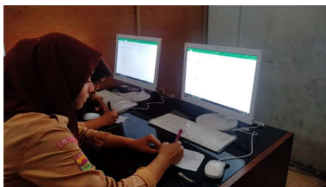
Gambar 3. Pemateri memberikan posttest