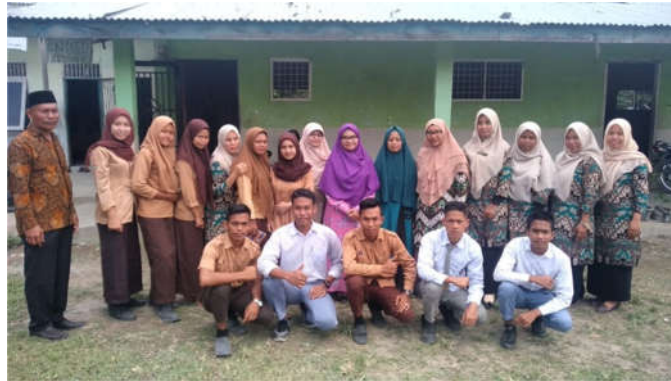
Gambar 4. Berfoto bersama Kepala Sekolah, Guru dan Siswa

dibantu dengan media pembelajaran berbasis IT yang sangat memberi kemudahan kepada siswa dalam belajar matematika.