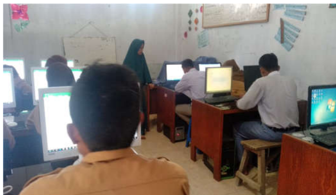
Gambar 2. Pemateri mempresentasikan bahan workshop