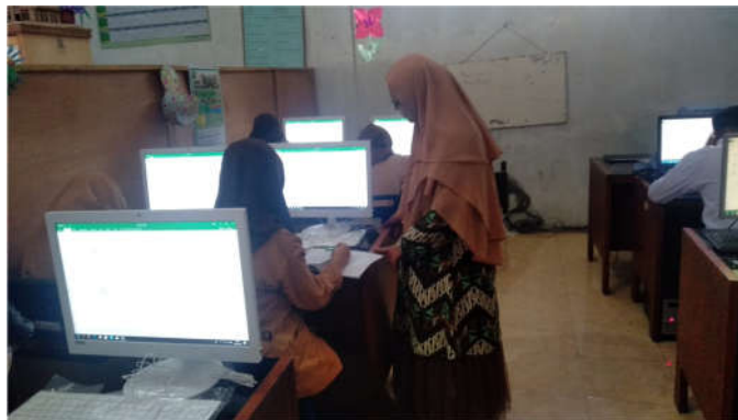
Gambar 1. Pemateri Memberikan Pretest