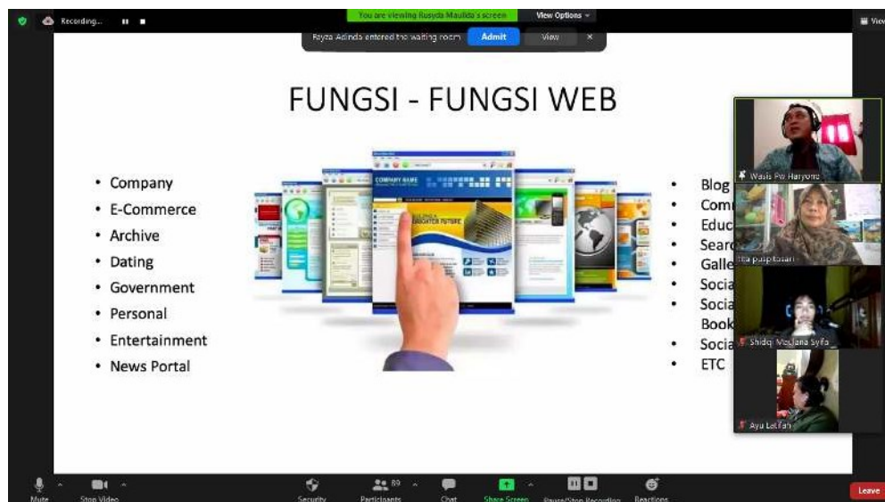
Gambar 2. Simulasi fungsi website