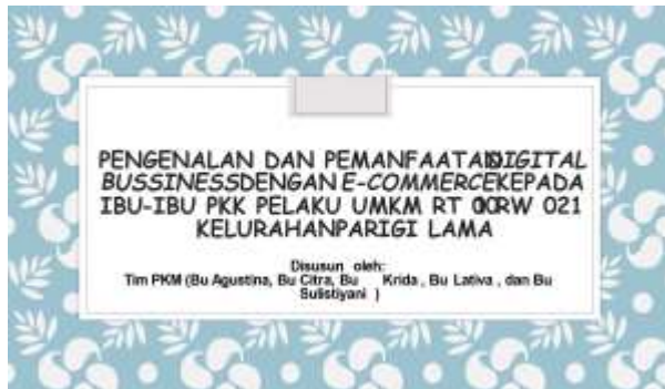
Gambar.2 Materi pengenalan dan pemanfaatan digital business