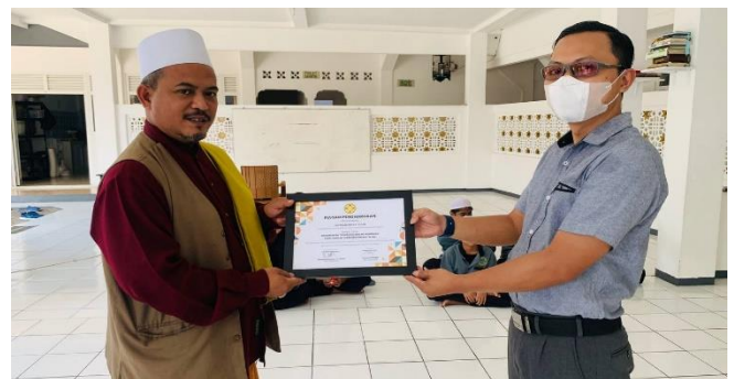
Gambar 3. 2 Simbolis pemberian piagam pada ketua Yayasan Yatim Piatu Hidayatullah

Hal yang perlu diperhatikan Mengenai asumsi bahwa pergeseran proses pembelajaran yang mengalami perubahan dari kertas ke online untuk saat ini telah dapat dirasakan maupun dilihat keberadaannya ketika sebuah instansi pendidikan menerapkan system komputerisasi. Banyak hal serta manfaat dari keberadaannya itu. Semisal ketika segala kegiatan yang berbasis pendidikan dapat di akses secara mudah lewat sebuah jaringan computer ataupun jaringan internet yang tentunya hal tersebut berkat adanya satelit yang dioperasikan, maka siswa, mahasiswa, guru, dosen ataupun seluruh warga dalam lingkup pendidikan tersebut mampu memperoleh segala informasi yang ingin didapatkan. Misalnya yang paling mutakhir adalah berkembangnya Cyber Teaching atau pengajaran maya, yaitu proses pengajaran yang