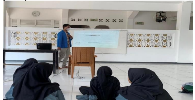
Gambar 3. 1 Kegiatan Pemaparan Materi 1

Kegiatan PKM ini memberikan edukasi dan pemahaman mengenai pemanfaatan teknologi secara bijak dan dengan benar dan efektif. Para peserta yayasan yatim piatu hidayatullah sangat tertarik dalam mengikuti kegiatan PKM ini. Hal ini tampak dari para audiens yang semangat mengikuti kegiatan sampai akhir acara dan cukup aktif dalam sesi diskusi dan pertanyaan.