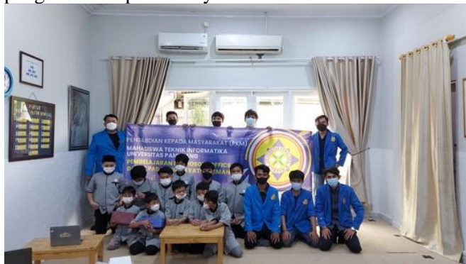
Gambar 6. Foto Bersama Setelah Kegiatan Oleh Para Peserta dan Tim Pengabdian Kepada Masyarakat

Sehingga dari pertanyaan tersebut tim pengabdian kepada masyarakat dapat mengetahui tingkat pemahaman peserta dan dijadikan sebagai bahan evaluasi kedepannya dalam melakukan kegiatan pengabdian kepada masyarakat.