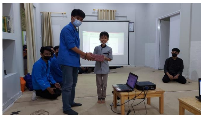
Gambar 7. Pemberian Hadiah Kepada Peserta

Dalam proses pembelajaran semua peserta mengikuti pembelajaran dengan antusias dan semangat, karena merasa perlu untuk memahami dasar-dasar Microsoft Office. Hal ini membuat pembelajaran yang diikuti oleh anak-anak Rumah Yatim Kemang menjadi sangat efektif dan dapat menambah pengetahuan tentang Microsoft Office dan penggunaannya, ini dapat dibuktikan dari pemahaman para peserta dalam menjawab pertanyaan dari tim pengabdian kepada masyarakat, dan memberikan sebuah hadiah kepada peserta yang dapat menjawab pertanyaan dari tim pengabdian membuat peserta lainnya lebih termotivasi untuk memahami materi dan menjawab pertanyaan dari tim pengabdian.