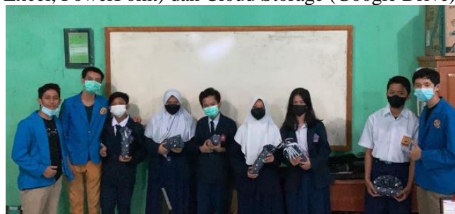
Gambar 3.2 Foto 6 Peserta Aktif

Lalu sesi yang ketiga mengenai dasar-dasar pemakaian rumus-rumus pada Microsoft Excel. Dan disesi yang ke empat siswa diajarkan bagaimana cara penggunaan cloud storage pada google drive. Ketercapainya dari hasil kegiatan ini dapat dilihat dari antusias dan hasil kreatifitas siswa/i saat melakukan praktik dalam menggunakan Microsoft Office (Word, Excel, PowerPoint) dan Cloud Storage (Google Drive).