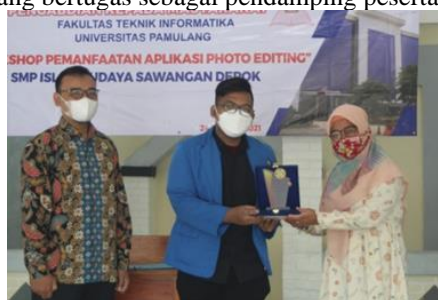
Gambar 1. Penyerahan Plakat Oleh Ketua Pelaksana Kepada Kepala Sekolah SMP Islam Budaya

Kegiatan dilaksanakan melalui pengenalan aplikasi secara tatap muka, lalu dilanjutkan dengan praktek penggunaan aplikasi tahap demi tahap dengan cara tutor memberikan instruksi dan diikuti oleh peserta pelatihan serta dibantu panitia yang bertugas sebagai pendamping peserta.