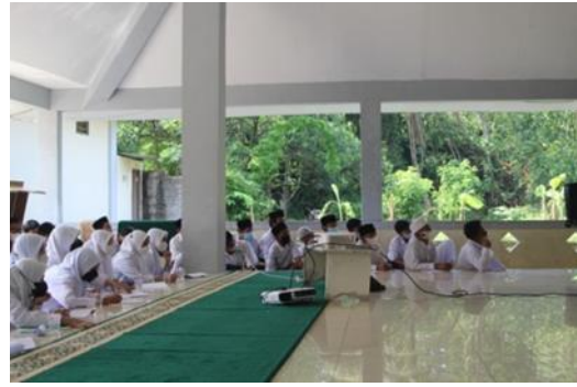
Gambar 3. Pengenalan dan pemberian materi photo editing menggunakan Adobe Photosop