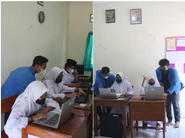
Gambar 4. Pelatihan dan praktek di ruang Lab.

Hasil dari kegiatan PKM yang sudah dilakukan adalah sebagai berikut :