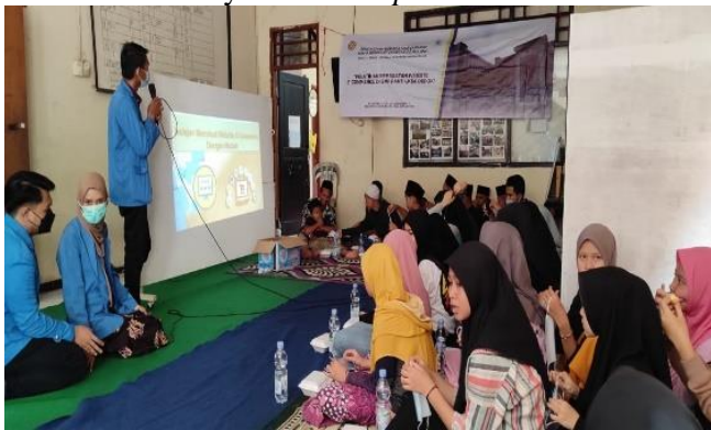
Gambar 3. 1 Presentasi Pengenalan Website

HTML merupakan bahasa standar pemrograman yang digunakan untuk membuat sebuah halaman website yang diakses melalui internet. HTML disusun berdasarkan kode tertentu lalu dimasukkan dalam sebuah file agar bisa ditampilkan pada layar komputer. Sehingga mudah dipahami oleh user atau pengguna internet. Sedangkan notepad merupakan software teks editor sederhana yang bisa digunakan user untuk membuat dokumen. Notepad juga dapat digunakan untuk menulis program sederhana berbasis html dan php . Notepad yang biasa digunakan untuk program sederhana biasanya ialah Notepad++ .