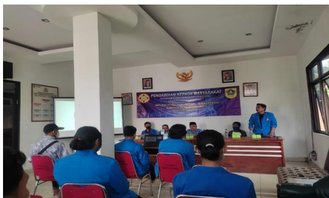
Gambar 3. 2 Sesi Pertanyaan

Waruwu, M. A. (2021, Agustus 24). Tips Melindungi data pribadi di internet . Retrieved from Qubisa.com: https://www.qubisa.com/article/Melindungi-data-pribadi-di-internet