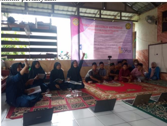
Gambar 2. Tim PKM memberikan waktu tanya jawab

Pada gambar 1 terlihat pemateri memberikan penjelasan materi tentang pembuatan makalah dengan microsoft office word. Pada saat memberikan penjelasan materi, peserta dengan seksama mendengarkan materi. Adapun beberapa peserta yang mencatat nya pada buku tulis yang mereka bawa. Setelah memberikan penjelasan tentang pembuatan makalah dengan microsoft office word, maka Tim PKM memberikan waktu untuk bertanya bagi peserta yang memiliki pertanyaan.