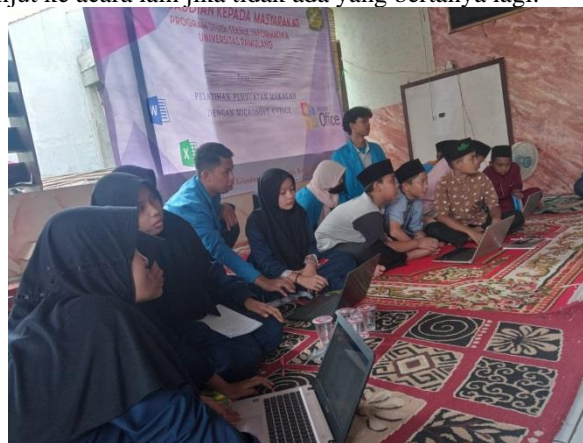
Gambar 4. Praktek beserta pembimbingan oleh tim PKM

Gambar 3, Pemateri sedang menjelaskan kembali materi yang peserta tanyakan. Lalu peserta merasa paham maka lanjut ke acara lain jika tidak ada yang bertanya lagi.