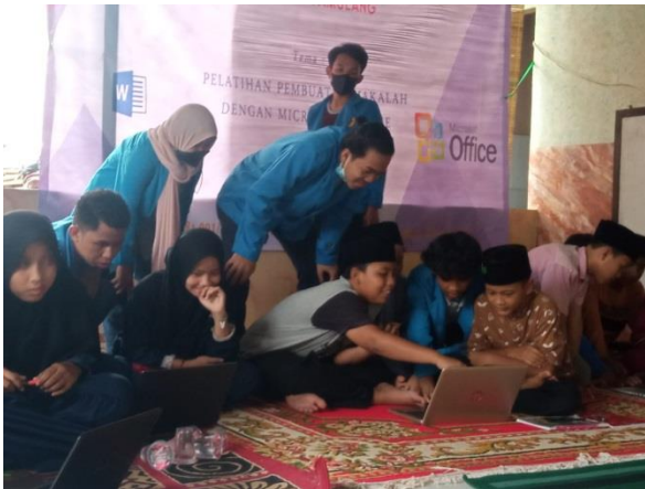
Gambar 5. Peserta senang dengan hasil buatan mereka

Gambar 5, para peserta terlihat senang dengan hasil makalah yang mereka buat saat praktek. Hal ini karena hasil yang mereka buat sesuai dengan apa yang diinginkan oleh pemateri. yang mereka buat sesuai dengan apa yang diinginkan oleh pemateri.