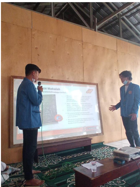
Gambar 1. Foto Pemaparan Materi oleh Tim PKM

Pada gambar 1 terlihat pemateri memberikan penjelasan materi tentang pembuatan makalah dengan microsoft office word. Pada saat memberikan penjelasan materi, peserta dengan seksama mendengarkan materi. Adapun beberapa peserta yang mencatat nya pada buku tulis yang mereka bawa. Setelah memberikan penjelasan tentang pembuatan makalah dengan microsoft office word, maka Tim PKM memberikan waktu untuk bertanya bagi peserta yang memiliki pertanyaan.