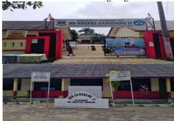
Gambar 3. 1 Tampak Depan Halaman dan Pintu Masuk SDN Dangdang II

classroom karena di Tim kami ada yang mencari tempat PKM di daerah desa Dangdang tersebut.