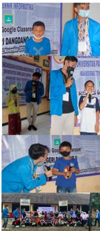
Gambar 3. 4 Sosialisasi Berlangsung & Selesai

Dari hasil Gambar diagram 3.3 diatas selama sosialisasi google classroom berlangsung sudah dapat dilihat hasil dari menguasainya google classroom untuk siswa-siswi SDN Dandang II kurang lebih dari total 60 siswa-siswi yang ikut sosialisasi ada diantara kelas 4, 5, dan 6. Dan selama sosialisasi berlangsung kami mengada-kan kuis untuk siswa-siswi dangdang II dan ada hampir 40 siswa-siswi yang dinyatakan dapat menjawab pertanyaan kami mengenai terkait google classroom . Siswa-siswi SDN Dandang II ini sangat begitu aktif kami pun sangat senang & bersemangat saat pemaparan materi dan kuisnya selama Sosialisasi berlangsung.