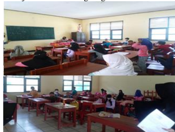
Gambar 3. 2 Suasana pada saat kegiatan PKM

Alhamdulillah setelah kegiatan PKM dengan tema Sosialisasi Google Classroom yang kami laksanakan di SDN Dangdang II, kami dapat melihat bisa atau tidaknya Google Classroom ini di pergunakan untuk pembelajaran di SDN dangdang II.