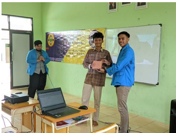
Gambar 3. 6 Penyerahan Hadiah kepada Siswa