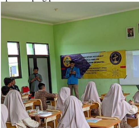
Gambar 3. 1 Sambutan Ketua Tim PKM Mahasiswa

Sosialisasi ini dilaksanakan pada tanggal 19 Maret 2022 pukul 08.00 – 11.25 WIB. PKM ini dihadiri peserta sebanyak 25 siswa yang seluruhnya terdiri dari 13 siswa putra dan Anggota 12 siswi putri dan panitia PKM. Kegiatan dilaksanakan melalui pengenalan Microsoft Office secara tatap muka, lalu dilanjutkan dengan praktek penggunaan Microsoft Office tahap demi tahap dengan cara pemateri memberikan instruksi dan diikuti oleh siswa dan siswi serta dibantu panitia yang bertugas sebagai pendamping peserta.