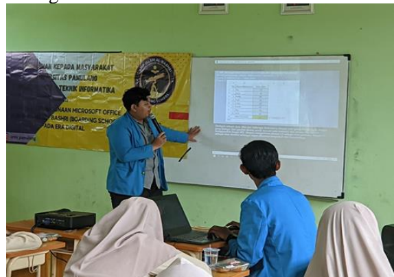
Gambar 3. 2 Penjelasan Materi Microsoft Office Excel