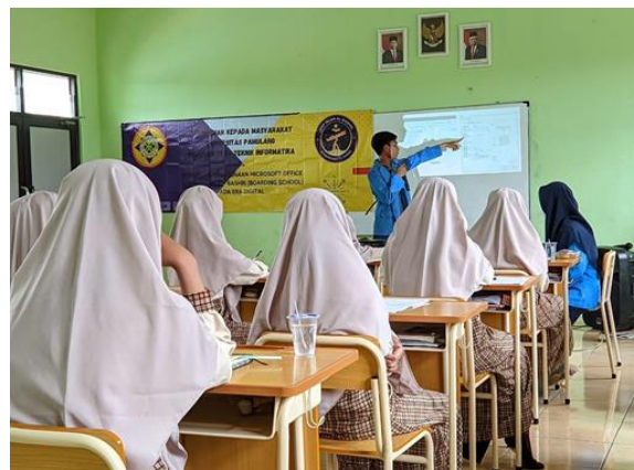
Gambar 3. 4 Penjelasan Materi Microsoft Office Word