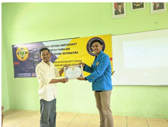
Gambar 3. 7 Penyerahan Sertifikat oleh Dosen Ketua Pelaksana PKM kepada Ketua Pihak Sekolah SMP Islam Al-Bashri

Hasil dari kegiatan ini berdampak baik bagi para siswa/i. Fakta dilapangan, ternyata rata-rata dari Siswa masih belum tahu fungsi dan dasar-dasar Microsoft Office, maka dari pemateri itu menjelaskan materi lalu dilanjutkan dengan pemberian pelatihan langsung. Kegiatan pelatihan ini berjalan dengan lancar, para peserta dapat menyerap informasi mengenai Microsoft Office (Word, Excel, PowerPoint) dan dapat mempraktekannya dengan baik.