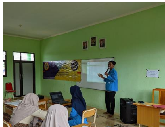
Gambar 3. 3 Penjelasan Materi Microsoft Office PowerPoint