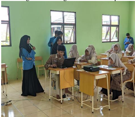
Gambar 3. 5 Siswa Praktek Microsoft Office Excel