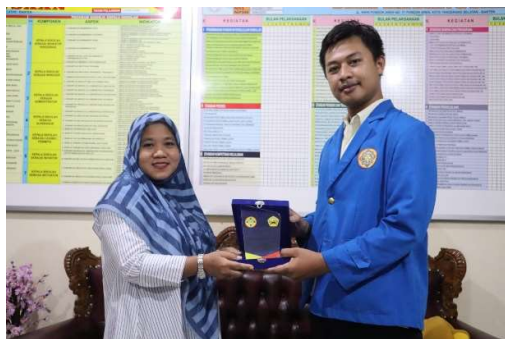
Gambar 3.7 Penyerahan Plakat ke pihak Kepala Sekolah SMK Kebangsaan