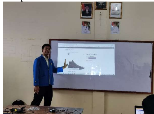
Gambar 3.4 Penyampaian Materi 2