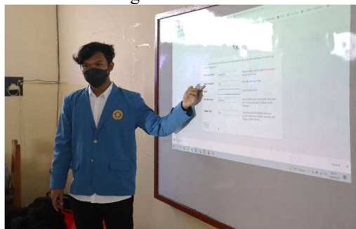
Gambar 3.3 Penyampaian Materi 1