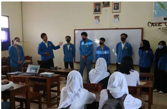
Gambar 3.1 Pengenalan para mahasiswa

memperkenalkan diri dan memberi ice breaking.