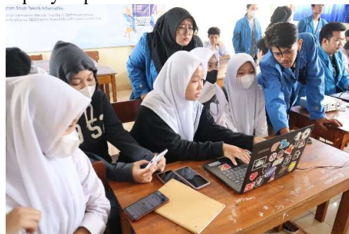
Gambar 3.6 Praktek membuat Website