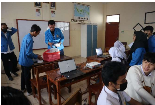
Gambar 3.2 Ice Breaking