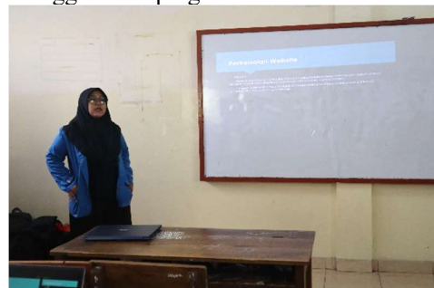
Gambar 3.5 Penyampaian Materi 3