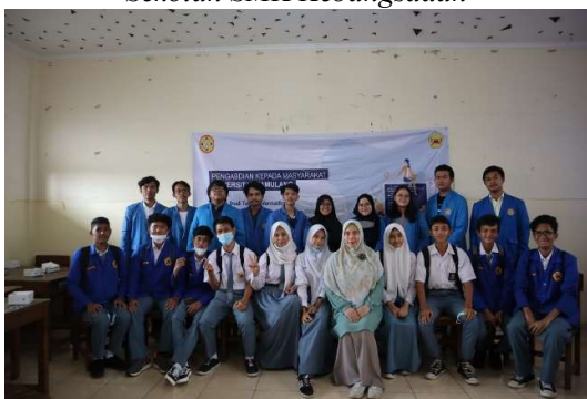
Gambar 3.8 Foto Bersama