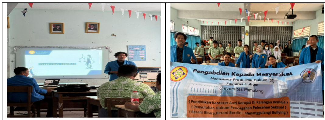
Gambar 4. Foto Pelaksanaan PKM di Kelas

Pada kegiatan ini, berbagai materi mendalam disajikan secara komprehensif, meliputi definisi dan bentuk-bentuk pelecehan seksual, peraturan perundang-undangan terkait, dampak terhadap kondisi psikologis korban, sekaligus langkah-langkah efektif untuk mencegah perilaku tersebut. 9 Poin menarik dari penyuluhan ini terletak pada metode penyampaian informasi yang interaktif dan variatif. Teknik seperti presentasi visual, diskusi kelompok, pemutaran video edukasi, hingga praktik simulasi role-play , terbukti mampu menciptakan suasana pembelajaran yang menarik sekaligus mampu mendorong siswa aktif berpartisipasi.