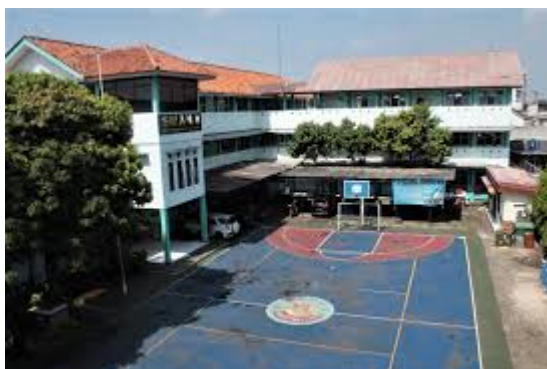
Gambar 1. Bangunan Gedung SMAN Tangerang Selatan 5

SMA Negeri 8 Kota Tangerang Selatan sendiri memiliki sejarah panjang yang menarik untuk diulas. Berdiri dari awal sebagai SMA Negeri Cireundeu, sekolah ini kemudian mengalami transformasi dan pada tahun 2009 resmi ditetapkan sebagai SMA Negeri 8 berlandaskan Peraturan Walikota. Secara geografis, sekolah ini terletak di Kecamatan Ciputat Timur, posisi yang sangat strategis karena berbatasan dengan dua wilayah penting, yaitu Jakarta Selatan dan Kota Depok.