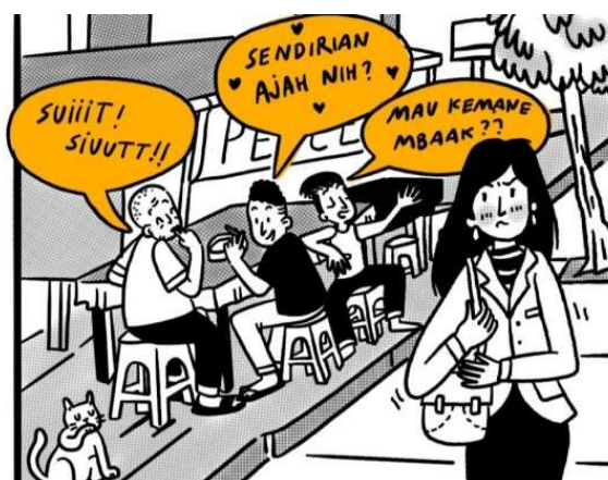
Gambar 5. Ilustrasi Catcalling di Ruang Publik

Pelecehan seksual verbal, sebagaimana dijelaskan oleh Gardner, merupakan salah satu bentuk pelecehan seksual yang terjadi di ruang publik. 16 Tindakan ini mencakup ucapan atau perilaku yang bersifat merendahkan, mengancam, atau bernuansa seksual, baik secara langsung maupun tidak langsung. Lokasi terjadinya pelecehan ini meliputi tempat-tempat umum seperti jalan raya, taman, gang, maupun tempat semi-publik seperti restoran dan bioskop. Contoh dari pelecehan seksual verbal di ruang publik antara lain hinaan, komentar bernada seksual, sindiran yang tidak pantas, teriakan, hingga penggunaan bahasa kasar yang ditujukan untuk melecehkan atau mengintimidasi individu. Fenomena ini tidak hanya mengganggu kenyamanan korban tetapi juga melanggar hak mereka untuk merasa aman di ruang publik.