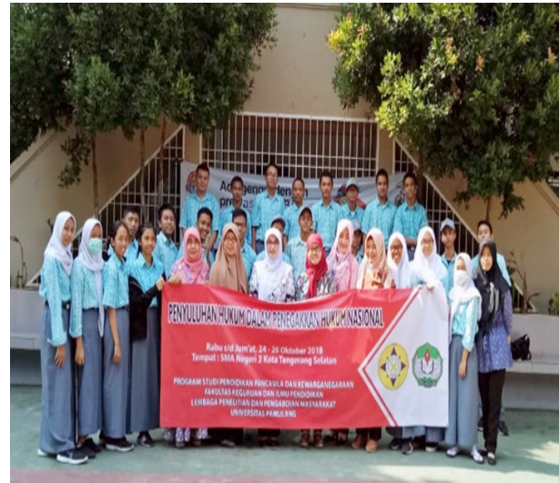
Gambar 3 Tim Dosen PKM bersama Siswa dan Guru

Hasil dari pengabdian masyarakat ini, dapat dilihat dari antusias siswa-siswi SMA Negeri 3 Tangerang Selatan untuk bertanya tentang aturan hukum yang ada di Indonesia. Tim Dosen PKM menjawab berbagai pertanyaan siswa yang sangat kritis terhadap permasalahan hukum yang ada. Tim Dosen PKM memberikan edukasi kepada peserta didik tentang dampak pelanggaran hukum yang terjadi serta implementasi penegakkan hukum yang ada dilingkungan sekitar siswa, mulai dari di lingkungan keluarga sampai di lingkungan sekolah sampai masyarakat. Salah satu upaya penegakkan hukum yang dapat dilakukan siswa di sekolah yaitu mentaati tata tertib yang berlaku di sekolah.