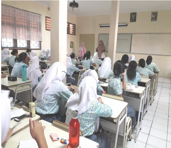
Gambar 2 Pelaksanaan Penyuluhan

Hasil dari pengabdian masyarakat ini, dapat dilihat dari antusias siswa-siswi SMA Negeri 3 Tangerang Selatan untuk bertanya tentang aturan hukum yang ada di Indonesia. Tim Dosen PKM menjawab berbagai pertanyaan siswa yang sangat kritis terhadap permasalahan hukum yang ada. Tim Dosen PKM memberikan edukasi kepada peserta didik tentang dampak pelanggaran hukum yang terjadi serta implementasi penegakkan hukum yang ada dilingkungan sekitar siswa, mulai dari di lingkungan keluarga sampai di lingkungan sekolah sampai masyarakat. Salah satu upaya penegakkan hukum yang dapat dilakukan siswa di sekolah yaitu mentaati tata tertib yang berlaku di sekolah.