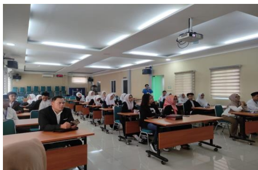
Gambar 1.2: Proses kegiatan PkM di lokasi kegiatan

ringan dan menyenangkan pemateri tidak lupa memberikan yel-yel sebagai penyemangat sekaligus ice breaking bagi peserta yang menyaksikan.