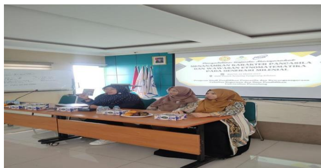
Gambar 1.3 : Proses kegiatan sosialisasi pada saat sedang berlangsung

Kegiatan PKM Seminar dengan tema Menanamkan karakter Pancasila dan etnomatematika pada generasi milenial selesai pukul 11:30 WIB dengan baik dan ditutup dengan doa, mengucapkan hamdallah serta foto bersama seluruh peserta kegiatan dan guru.