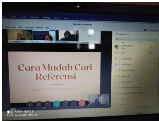
Gambar 2. Pelaksanaan PKM SMA Negeri 6 Tangerang Selatan via Webex

Pelatihan menulis adalah sebuah kegiatan yang dilakukan sebagai upaya kami melaksanakan proses tridarma perguruan tinggi dalam hal proses pengabdian kepada masyarakat. Dalam hal ini upaya peningkatan kemampuan menulis siswa meliputi penggunaan pustaka acuan dalam proses menulis karya ilmiah. Konsep pelatihan menulis berbasis pustaka acuan adalah sebuah konsep pelatihan yang berangkat dari konsep literasi sekolah, Literasi sekolah adalah sebuah konsep yang mendasari penyiapan sumber daya manusia yang layak dan dapat bersaing dengan SDM yang berasal dari negara lain. Ketika literasi awal masyarakat Indonesia sudah baik, maka dapat dipastikan konsep gerakan literasi di Indonesia dapat berjalan sesuai target.