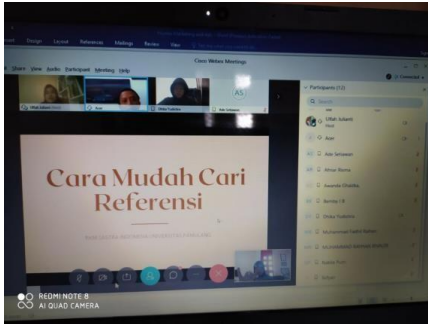
Gambar 1. Pelaksanaan PKM SMA Negeri 6 Tangerang Selatan via Webex