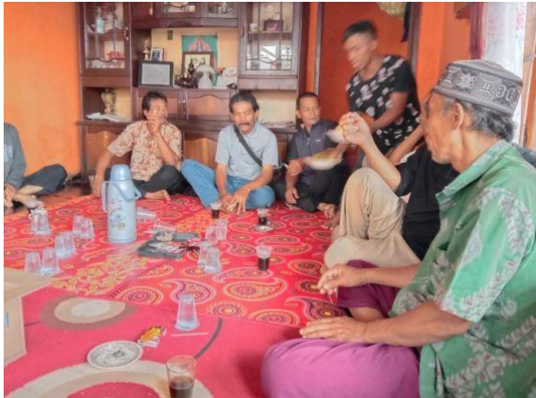
Gambar 2. Diskusi Materi Pelatihan-1