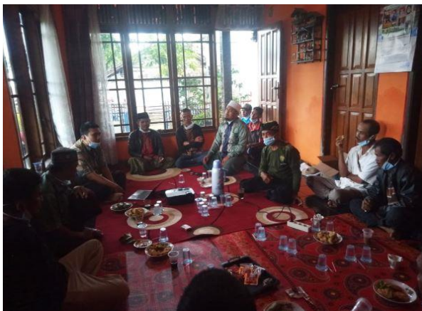
Gambar 3. Diskusi Materi Pelatihan-3