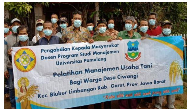
Gambar 1. Foto Bersama Narasumber dan peserta pelatihan

Adapun dokumentasi kegiatan pengabdian masyarakat seperti ditunjukkan pada gambar berikut: