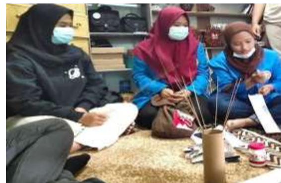
Gambar 1 Foto Saat Membuat Kerajinan Tangan Koran Melinting