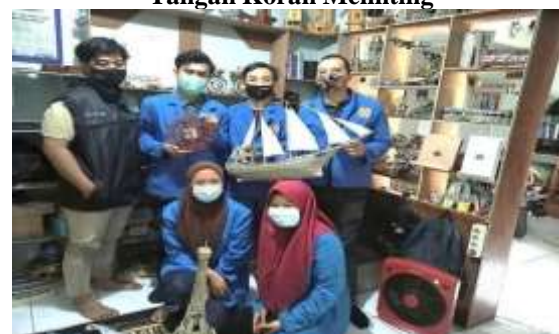
Gambar 2 Foto Bersama Dengan Founder Akasia Art Productions