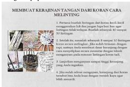
Cara Membuat Kerajinan Tangan dari Koran

Oleh karena itu kreativitas dan inovasi pada setiap lembaga pemerintah yang ingin maju harus menguatkan di internalnya terlebih dahulu, dengan demikian ketika di internalnya sudah kuat dan menghasilkan produk organisasi yang siap dan solid, otomatis ketika menghadapi permasalahan.