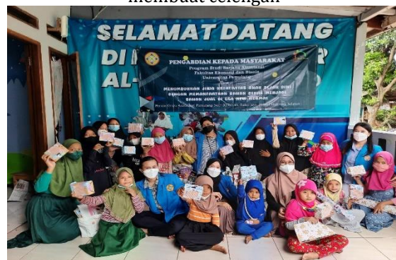
Gambar 3. Foto bersama panitia PmKM, sekertariat dan anak-anak.