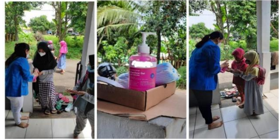
Gambar 1. Penerapan protocol kesehatan sebelum masuk ruangan