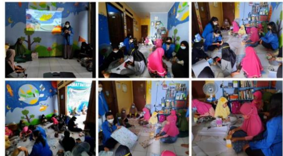
Gambar 2. Penyampaian materi dan praktek membuat celengan