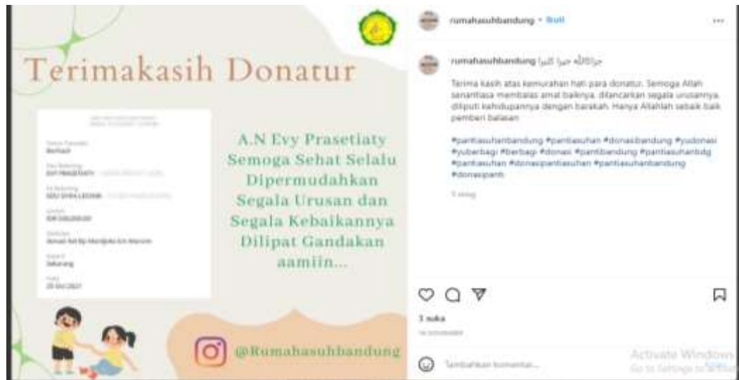
Gambar 2. Dokumentasi Informasi Media Sosial Yayasan Edu Syifa Lestari

Dalam laporan tersebut terdapat laporan pemasukan detail setiap bulan dengan keterangan yang diperlukan, misal kan ada pemasukan di bulan Juli 2021, kemudian dibuat detail pemasukannya selama satu bulan dengan menampilkan tiap tanggal pemasukan, berasal dari mana, keterangannya untuk apa dan berapa besarnya.