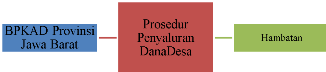
Gambar 1 Tata Cara Penyaluran Dana di Desa-Desa di Jawa Barat

Pada dasarnya survei ini dilakukan untuk mengetahui tata cara penyaluran dana desa di Jawa Barat. Oleh karena itu, peneliti menetapkan judul “Tata Cara Penyaluran Dana di Desa-Desa di Jawa Barat”. Saat menentukan judul, peneliti memperoleh, menyelidiki, dan mengolah data yang diperoleh langsung dari orang dalam. Untuk melakukan analisis ini, peneliti menggunakan beberapa elemen kontrol: pendanaan pedesaan dan prosedur untuk memandu hambatannya.