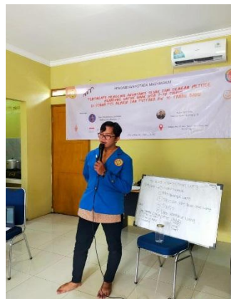
Gambar 1 Pemaparan Materi PmKM

Dalam pemaparan materi, Tim PmKM kami memberikan sebuah pengetahuan tentang pentingnya menabung, manfaat menabung, tips menabung dan metode menabung. Lalu tujuan dari di adakan nya kegiatan ini terhadap anak-anak adalah untuk menanamkan pribadi sejak dini untuk menabung karena menabung dapat berguna bagi masa depan anak-anak. Tim PmKM kami menjelaskan bagaimana cara menabung yang efektif dengan cara menyimpan uang yang diberikan oleh orang tua, menjelaskan tentang manfaat menabung, menjelaskan beberapa tips menabung dan metode menabung seperti menabung di celengan, menabung dengan target, dan menabung di rekening.