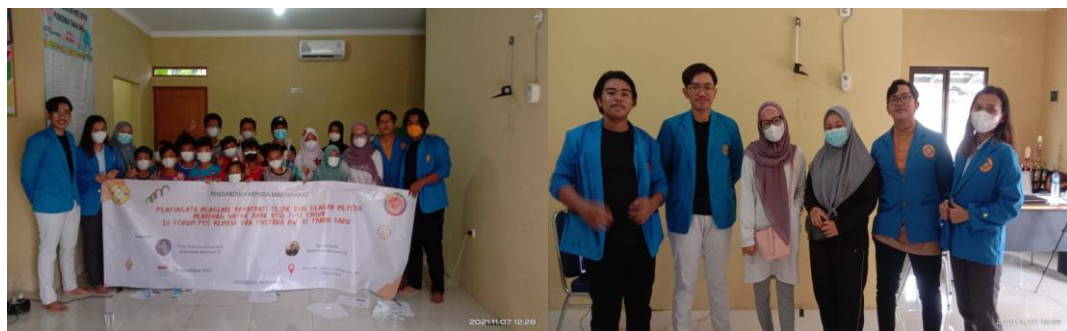
Gambar 3 Foto Bersama Tim PmKM dan Peserta PmKM