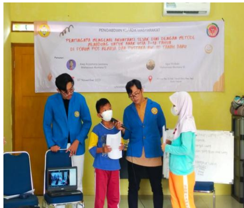
Gambar 2 Diskusi Tanya Jawab dan Games