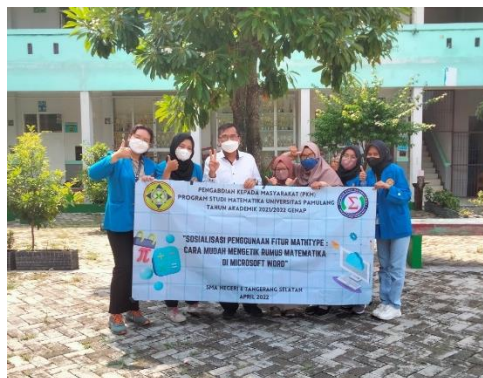
Gambar 3 Anggota tim PKM