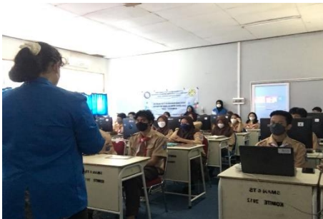
Gambar 1 Penyampaian materi

Penggunaan software Microsoft Word dan MathType dirasa sangat berkesinambungan serta berperan sejalan dengan kebutuhan siswa sebab dengan keduanya dapat membantu siswa mengetik rumus matematika tanpa kesulitan menyesuaikan dengan teks atau ketikan didalamnya. Tidak menutup kemungkinan ini akan menjadi bahan penyemangat bagi siswa menyelesaikan tugasnya dalam pengetikan rumus matematika.