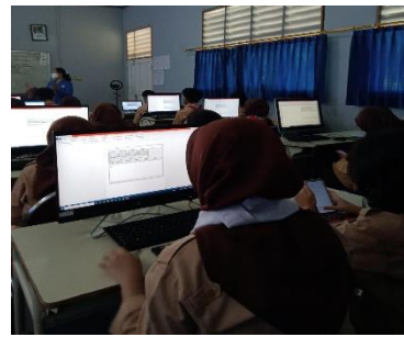
Gambar 2 praktek mengetik dengan MathType